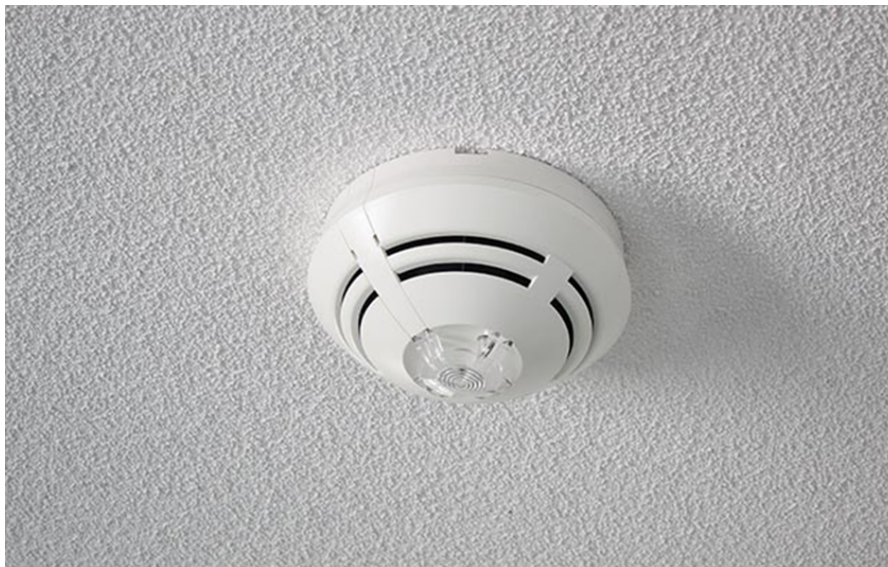
Abbildung 1: Nicht in allen Instituten zu finden: Ein Brandmelder.

Im Germanistischen Seminar wurden zwei funkverbundene Brandmelder im Eingangsbereich an der Decke montiert.