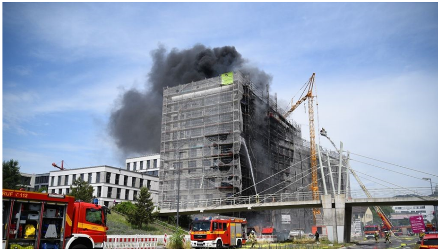
Abbildung 4: Großschadenslage in Heidelberg: Der Stadttorbrand 2022.